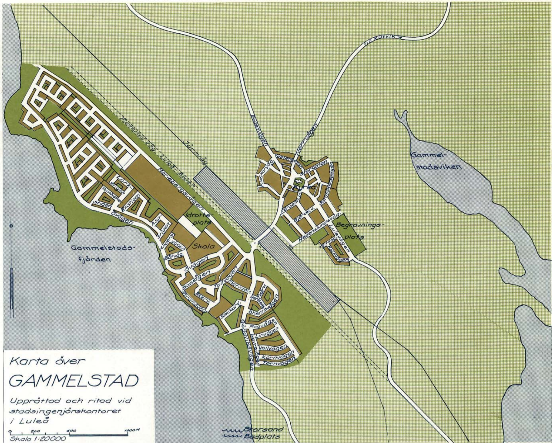
Karta över Gammelstad

Jävre. Arkeologstigen — promenad till stora gravrösen med vid utsikt över skärgården.