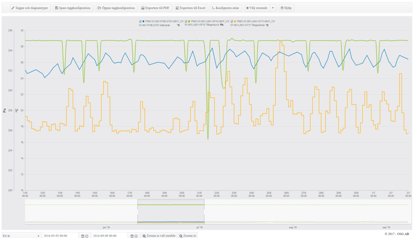
Figur 2: Visningsprogrammet OSG Trends